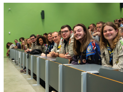
Info dag 21 mei 2023